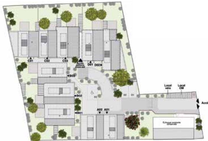
Plan de masse de la résidence CARRE SOLARIS

Le projet se déploie dans une enclave verte caractérisée par de beaux éléments paysagers et des orientations solaires optimales.