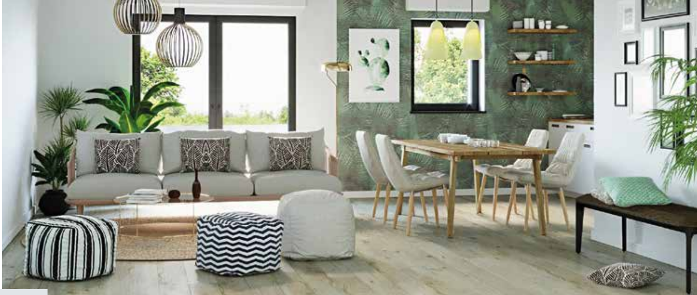
Ambiance d'un séjour lumineux et aménagé.